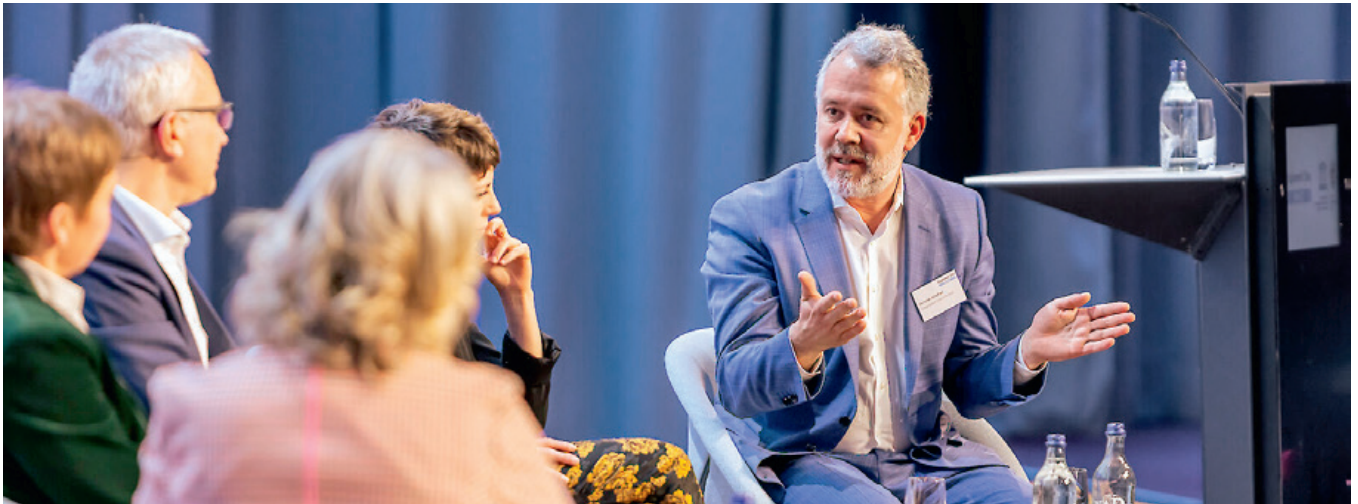
Netzwerken: am Engineers' Day und den Tagen der Technik 2023. Réseautage lors de la Journée mondiale de l'ingénierie et des Journées de la Technique.