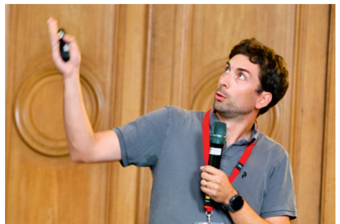
Impressionen von den Tagen der Technik in Dübendorf und Lausanne. Impressions des Journées de la technique à Dübendorf et Lausanne.